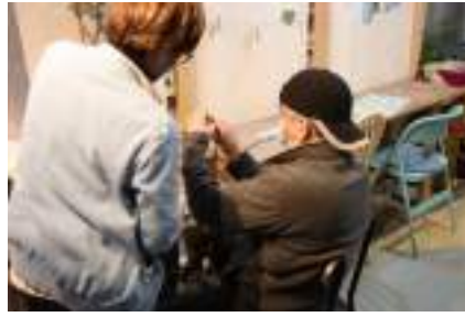
▲利用者へ作業を教えるスタッフ