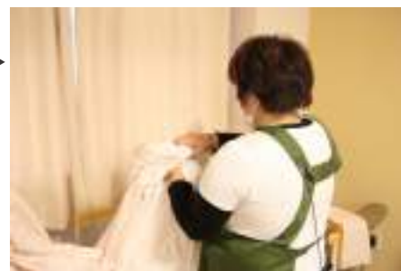
介護付有料老人ホーム ドリームステイひかり のリネン交換 ▶