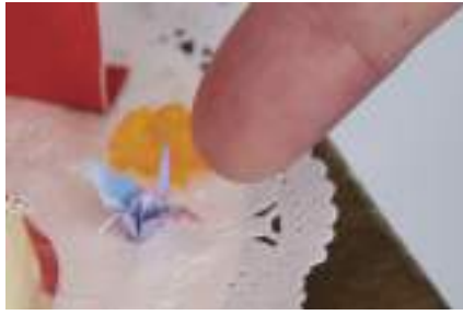
▲手先が器用な利用者が折った折り鶴