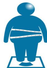
糖尿病・肥満・メタボ