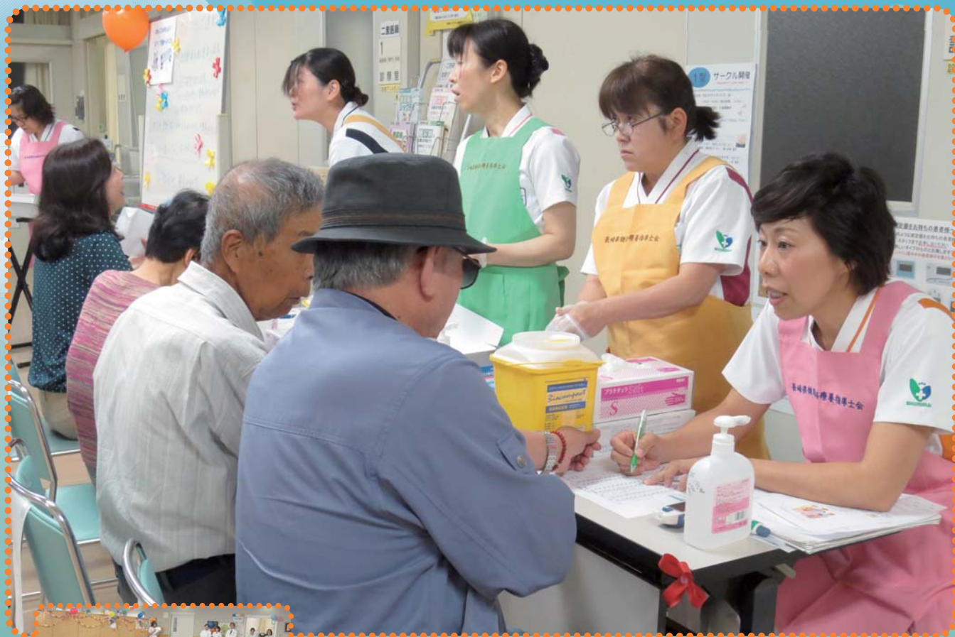
ふれあい健康フェスタ (関連記事は3ページ)