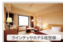
クインテッサホテル佐世保