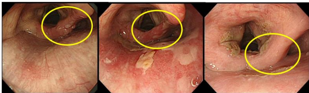
検診内視鏡にて発見