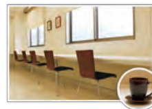
コーヒーでくつろぎタイム♪

検査や診察等の待ち時間を、くつろいで過ごしていただけるよう人間ドックご利用の方専用のラウンジをご準備しております。