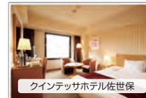
クインテッサホテル佐世保