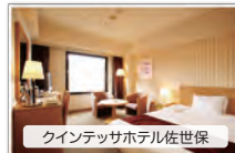
クインテッサホテル佐世保