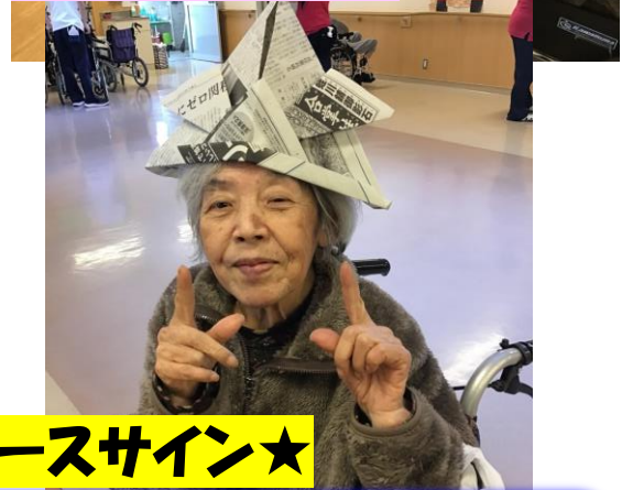
笑顔でピースサイン★