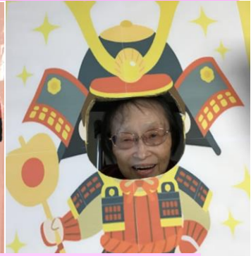
わしは武士になる!!