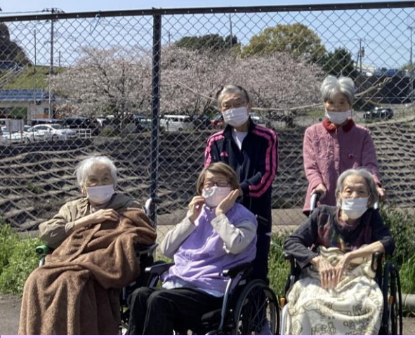
桜を背景にハイポーズ